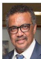
Tedros Adhanom Ghebreyesus