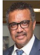
Tedros Adhanom Ghebreyesus