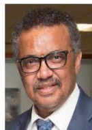
Tedros Adhanom Ghebreyesus