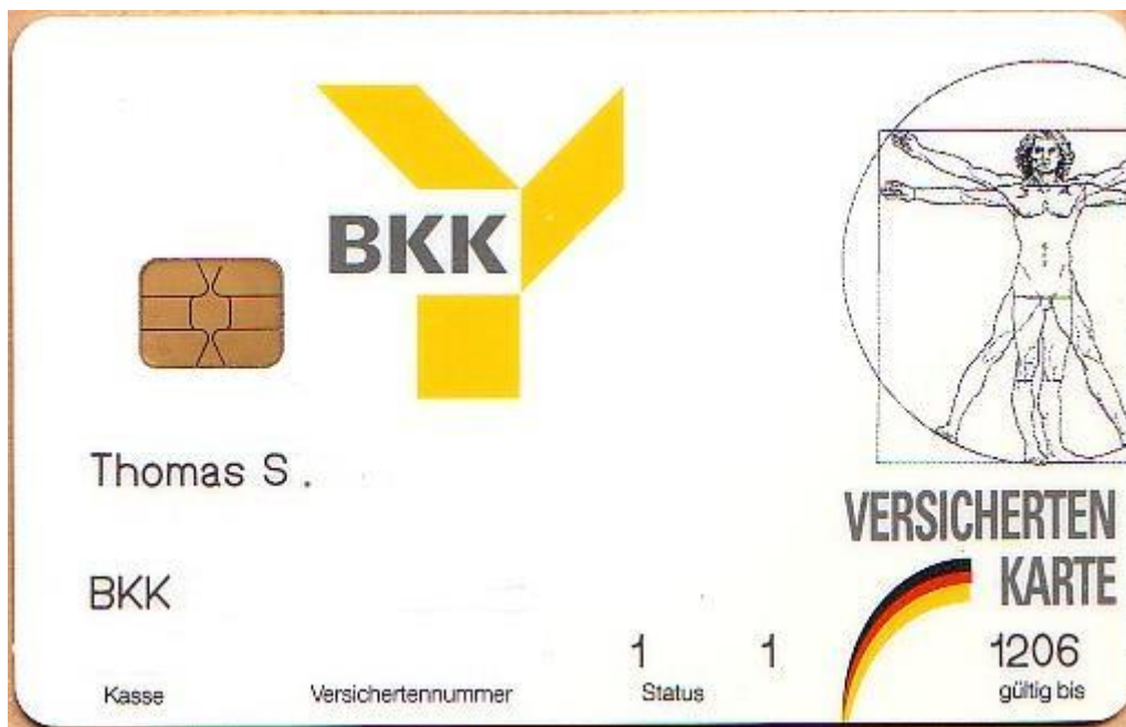
Modello di carta d'assicurazione malattia in Germania e l'Uomo vitruviano.

Pentitevi prima che sia troppo tardi. L'inferno è reale ed è eterno.