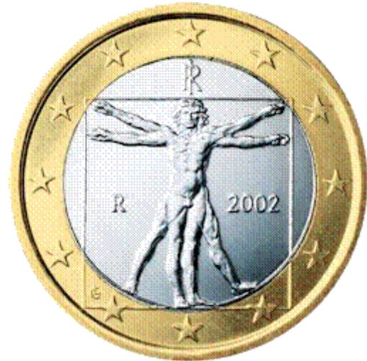
La moneta italiana di 1 euro E L'Uomo vitruviano.