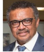
Tedros Adhanom Ghebreyesus